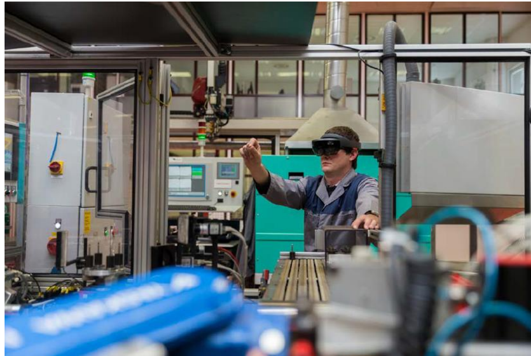
Digitalna vizualizacija v delovnih procesih (Kolektor KFH d.o.o.)

Nove organizacijske metode v poslovnih praksah, v organizaciji delovnega mesta ali pri zunanjih odnosih